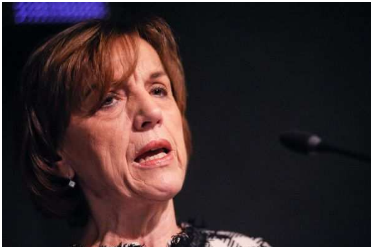
Elsa Fornero, ex ministro del Lavoro

Nel 2015 sono state erogate dall’Inps 92.528 nuove pensioni di anzianità, un aumento del 72,8 per cento sul 2014. L’età di accesso a questo tipo di assegno è di 60,6 anni, rispetto ai 59,1 del 2010. Sono alcuni dati del rapporto pubblicato mercoledì dall’istituto previdenziale, che smascherano (pur senza dirlo esplicitamente) una delle balle più gettonate di questi anni: che la riforma di Elsa Fornero del dicembre 2011 avrebbe reso gli italiani prigionieri della gabbia di lavoratori a oltranza, quasi privati del diritto alla pensione; creando poi una odiosa categoria di deportati sociali, gli esodati. Certo, gli esodati ci sono, e costano moltissimo ai contribuenti (pensionati inclusi): come evidenzia un altro documento dell’Ufficio parlamentare di Bilancio, questo passato sotto silenzio, intitolato “Il problema degli esodati e le salvaguardie della riforma Fornero”, con la legge di Stabilità 2016 siamo già a sette misure di salvaguardia per un totale, finora, di 196.530 persone e un esborso pubblico di 11,4 miliardi in cinque anni, cioè il 13 per cento del risparmio atteso – 88 miliardi – dalla riforma stessa nel decennio 2012-2021.